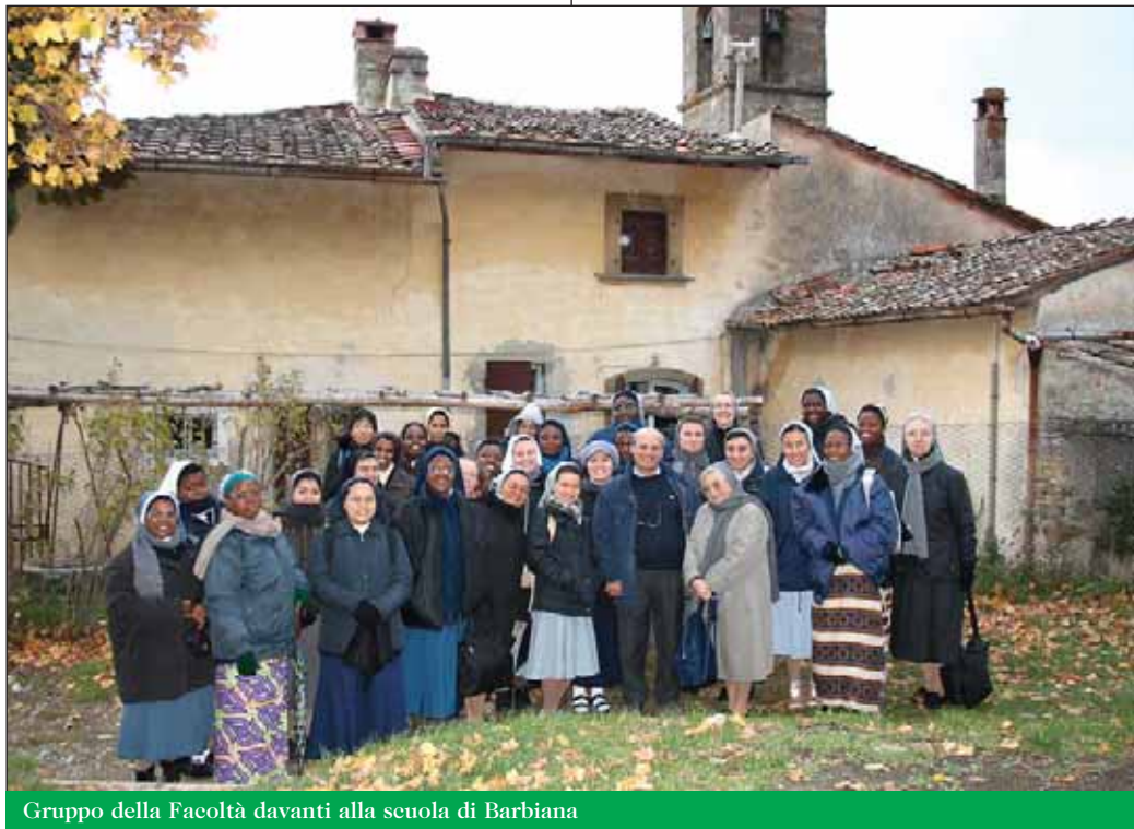
Gruppo della Facoltà davanti alla scuola di Barbiana

Un conto è leggere dov'è Barbiana, un al-