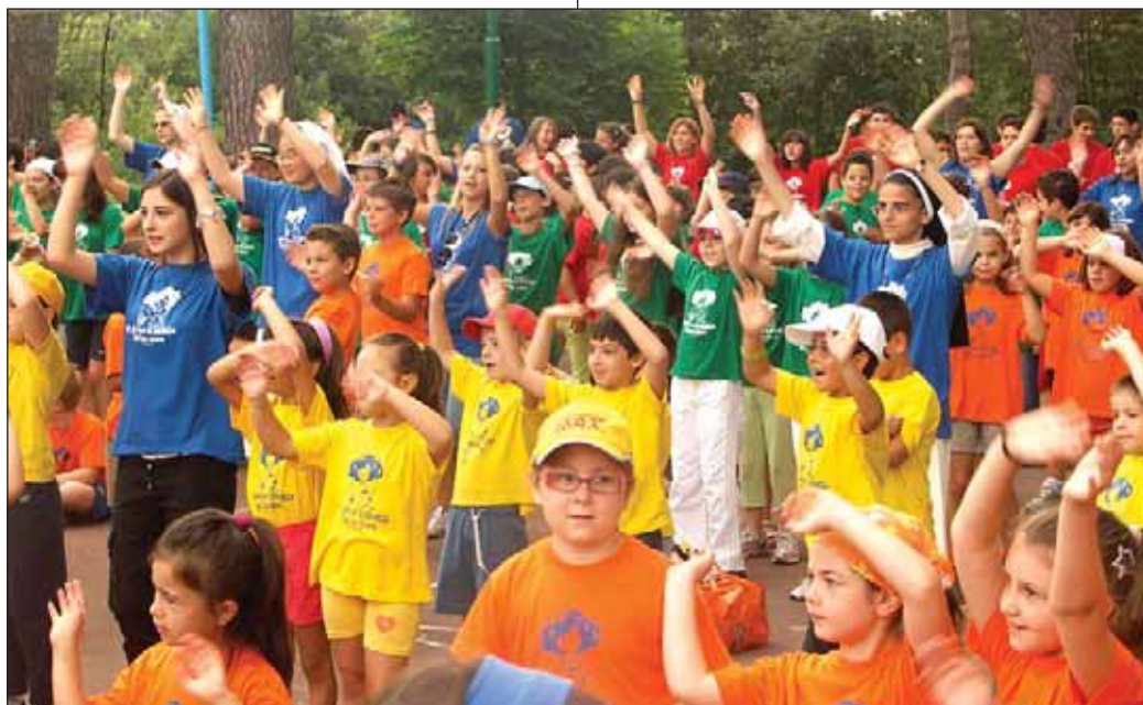
Partecipanti al Grest 2007