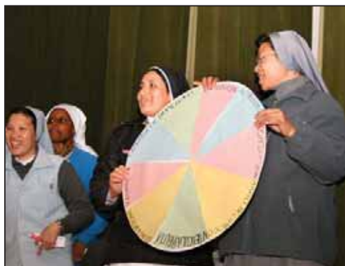
Un altro momento della Festa delle Matricole