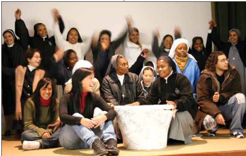
La Festa delle Matricole all'Auxilium