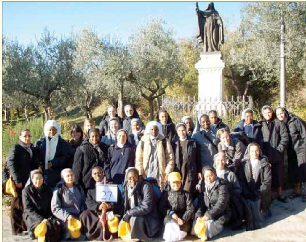
In pellegrinaggio ad Assisi...

conoscenza dei vicini (personalmente ho conosciuto meglio alcune colleghe di corso). Terza e ultima tappa: esame di coscienza da fare in silenzio. Dopo questo lungo e faticoso, ma piacevole pellegrinaggio, siamo finalmente giunti alla tanto attesa basilica di san Francesco. Abbiamo visitato la cripta, la parte inferiore e superiore della grande basilica medievale,