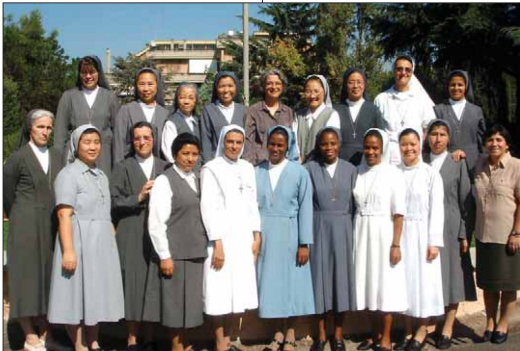
Il gruppo del primo anno del Corso di Spiritualità