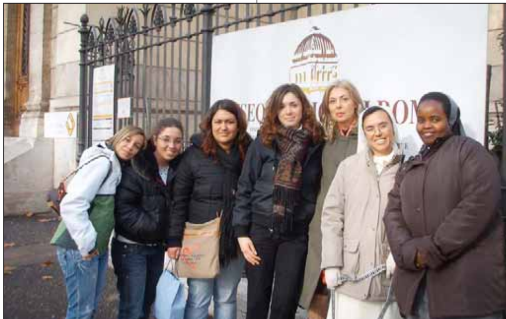
In visita al quartiere ebraico di Roma

Altrettanto interessante è stata la visita guidata per le vie del Ghetto, durante la quale la guida ci ha mostrato delle foto documentarie a confronto con le costruzioni attuali, a testimonianza delle trasformazioni avvenute nel quartiere stesso, e ci ha illustrato le ragioni della scelta di quella zona