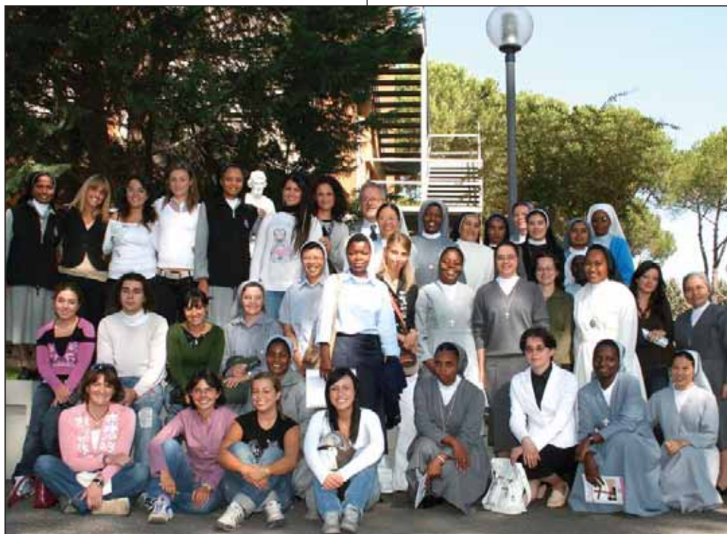
Il gruppo delle matricole