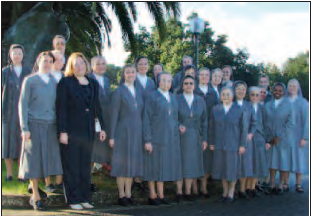
Docenti della Facoltà nel giorno dell'apertura dell'anno accademico