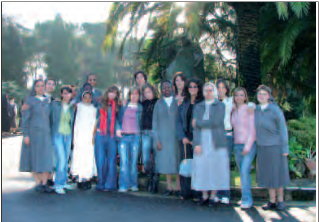
Gli studenti del quarto anno