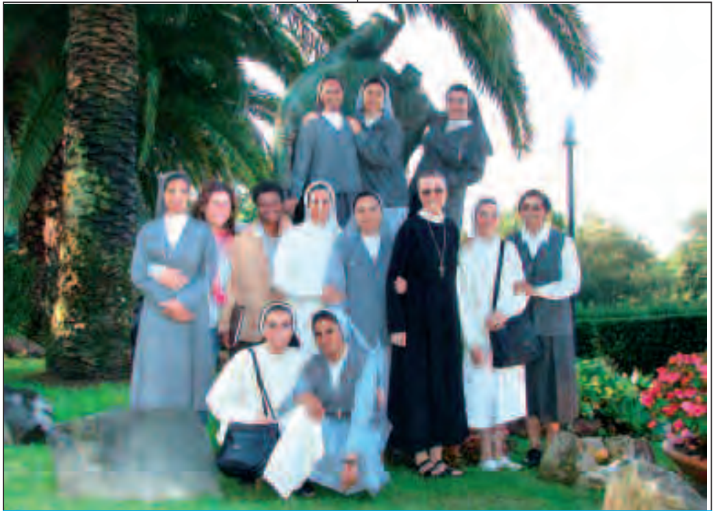
Gli studenti del terzo anno