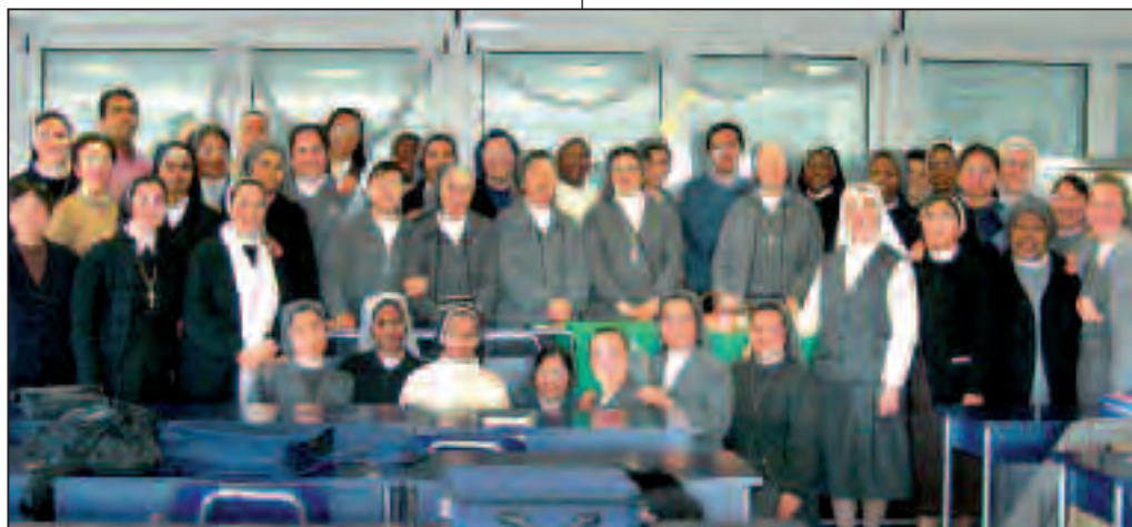
Studenti del corso annuale per Formatrici e Formatori nell'ambito della Vita Consacrata.