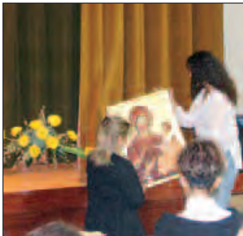
Il quadro della Madonna portato in processione