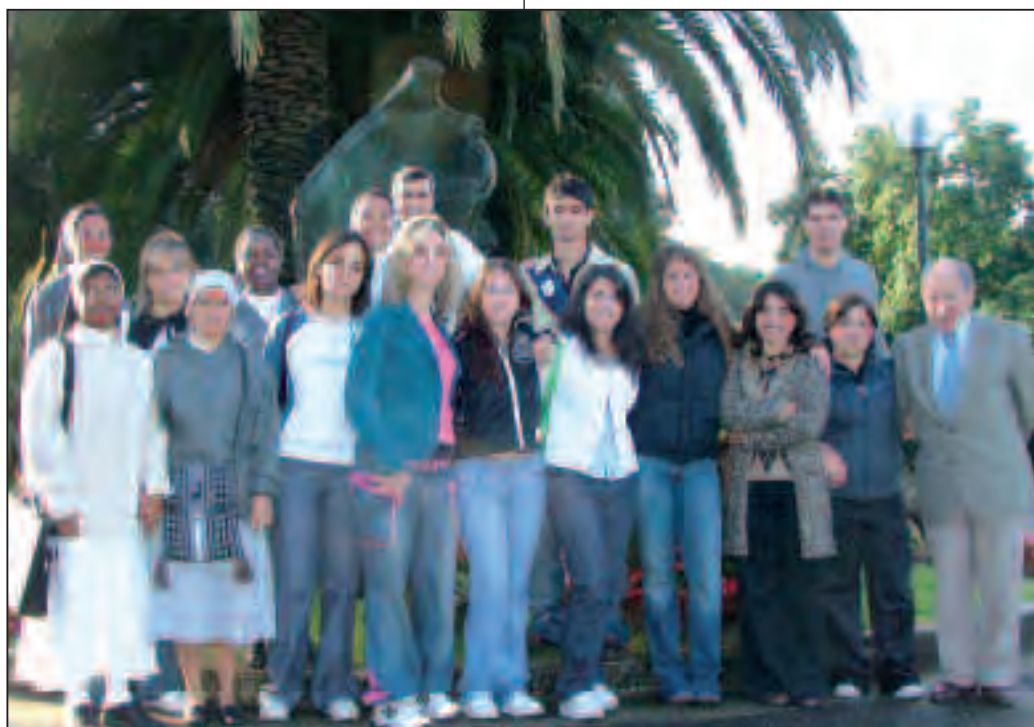
Gli studenti del secondo anno