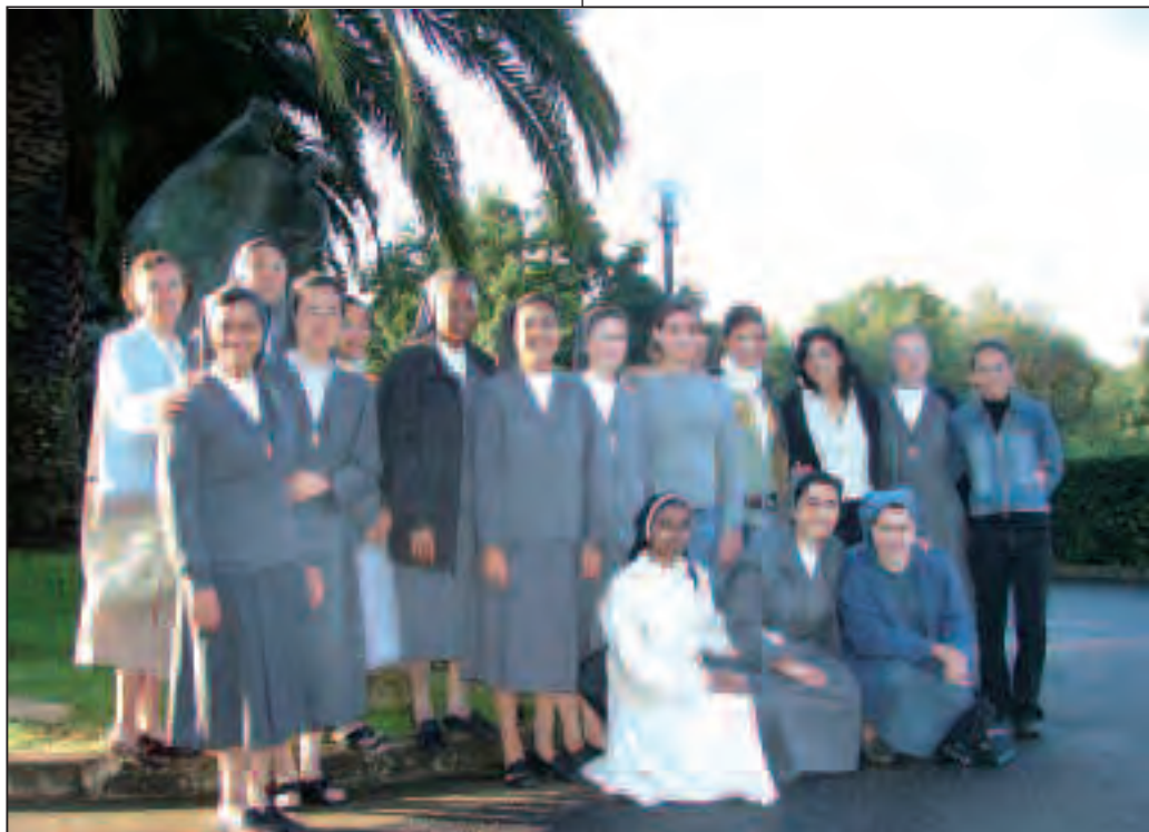
Gli studenti del quinto anno