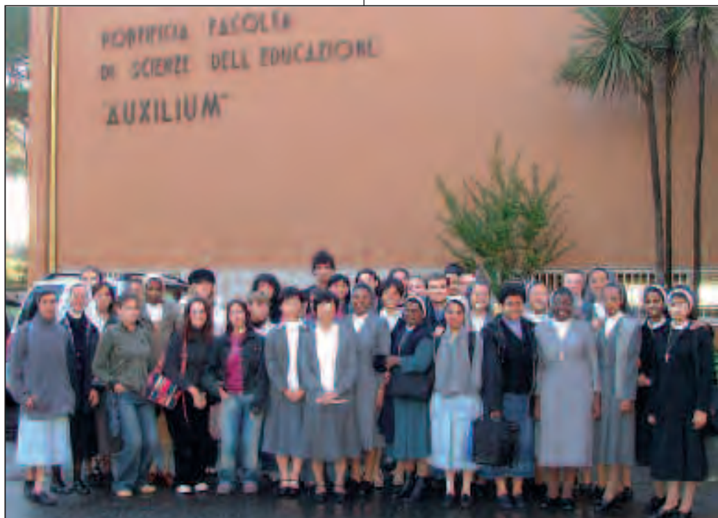
Gli studenti del primo anno