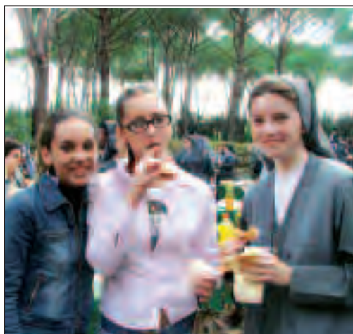
Momenti di rinfresco e di condivisione