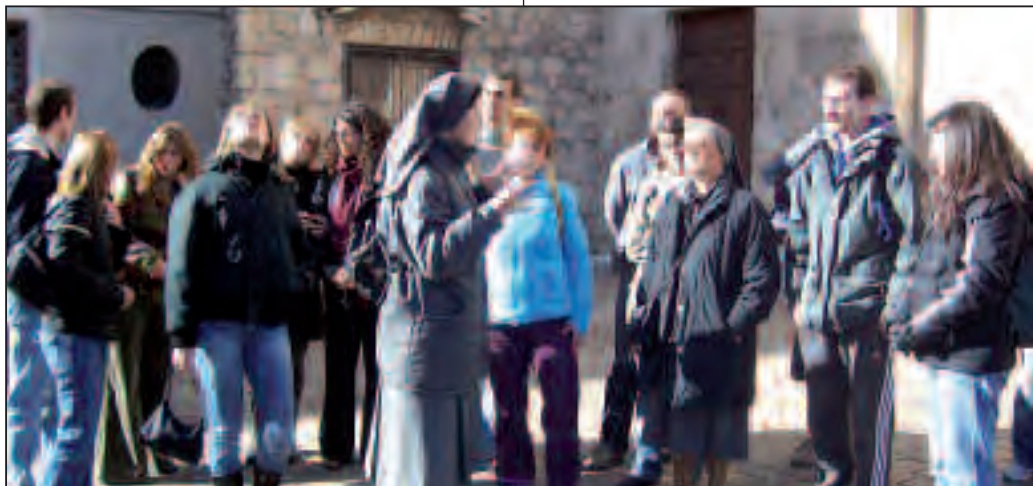
Week-end di fraternità ad Agnani e dintorni