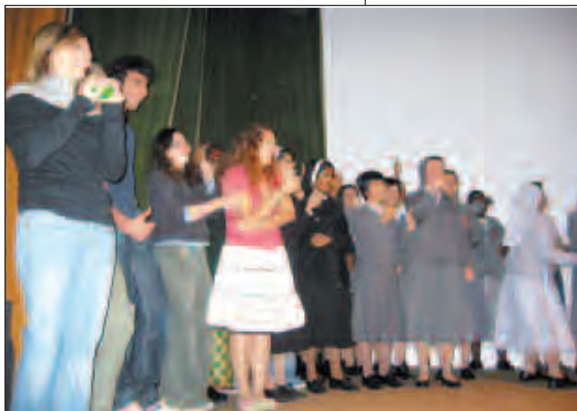
Alcuni studenti del primo anno durante la festa delle matricole

del prezioso lavoro che viene svolto nella Diocesi da molti membri della comunità accademica e dalla comunità religiosa delle FMA e incoraggia a continuare nella reciproca collaborazione.